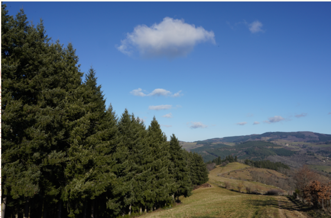
Paysage dans les monts du Beaujolais.

L'agroforesterie consiste à associer des pratiques arboricoles et agricoles dans une même unité de production (par exemple : les haies bocagères, le pâturage sous couvert forestier). Elle constitue une solution possible, de plus en plus plébiscitée, pour répondre aux enjeux environnementaux et climatiques actuels. Elle contribue également à redessiner les interfaces entre les paysages agricoles et forestiers, et ainsi à dissoudre la compartimentation qui s'est établie entre les deux secteurs au fil des siècles, tant du point de vue de leur répartition dans l'espace que de leurs modes de gestion.